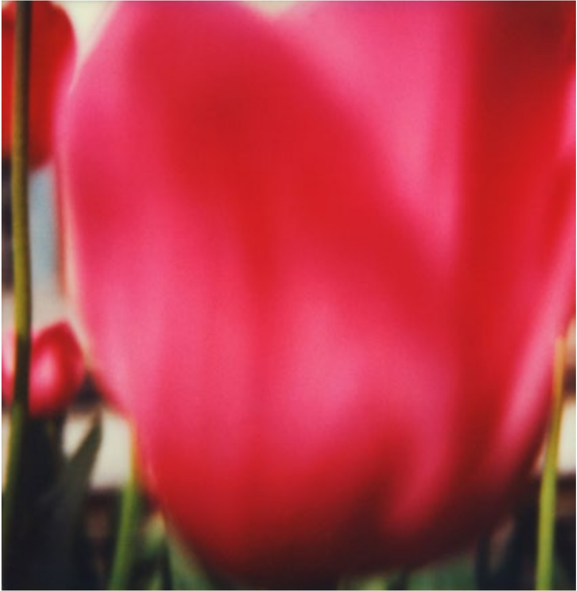
in paradiso, lambda-print, 1m × 1m, unikat, 2011