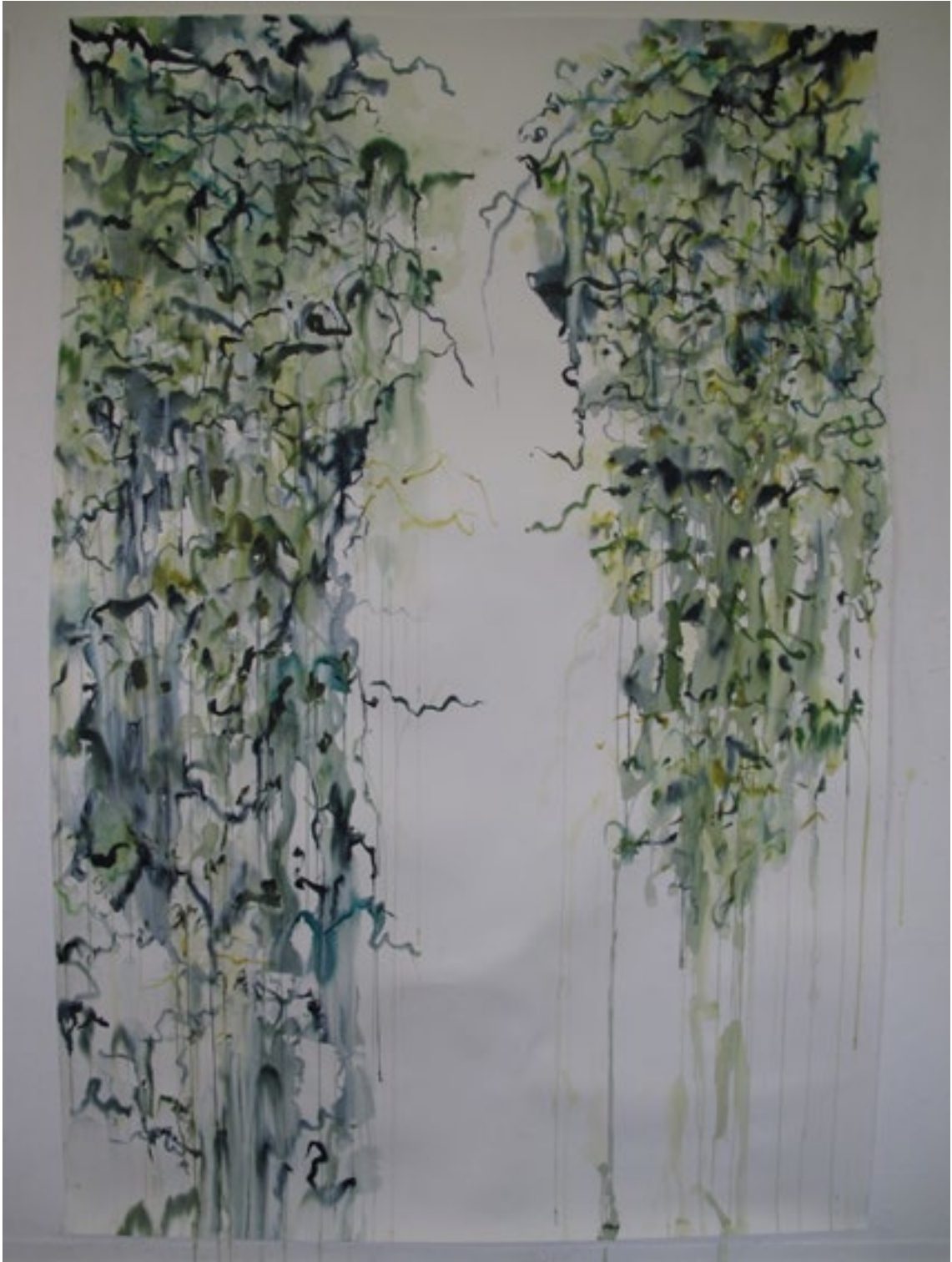
hängende gärten, aquarell, 200 × 135cm, 2011/2017