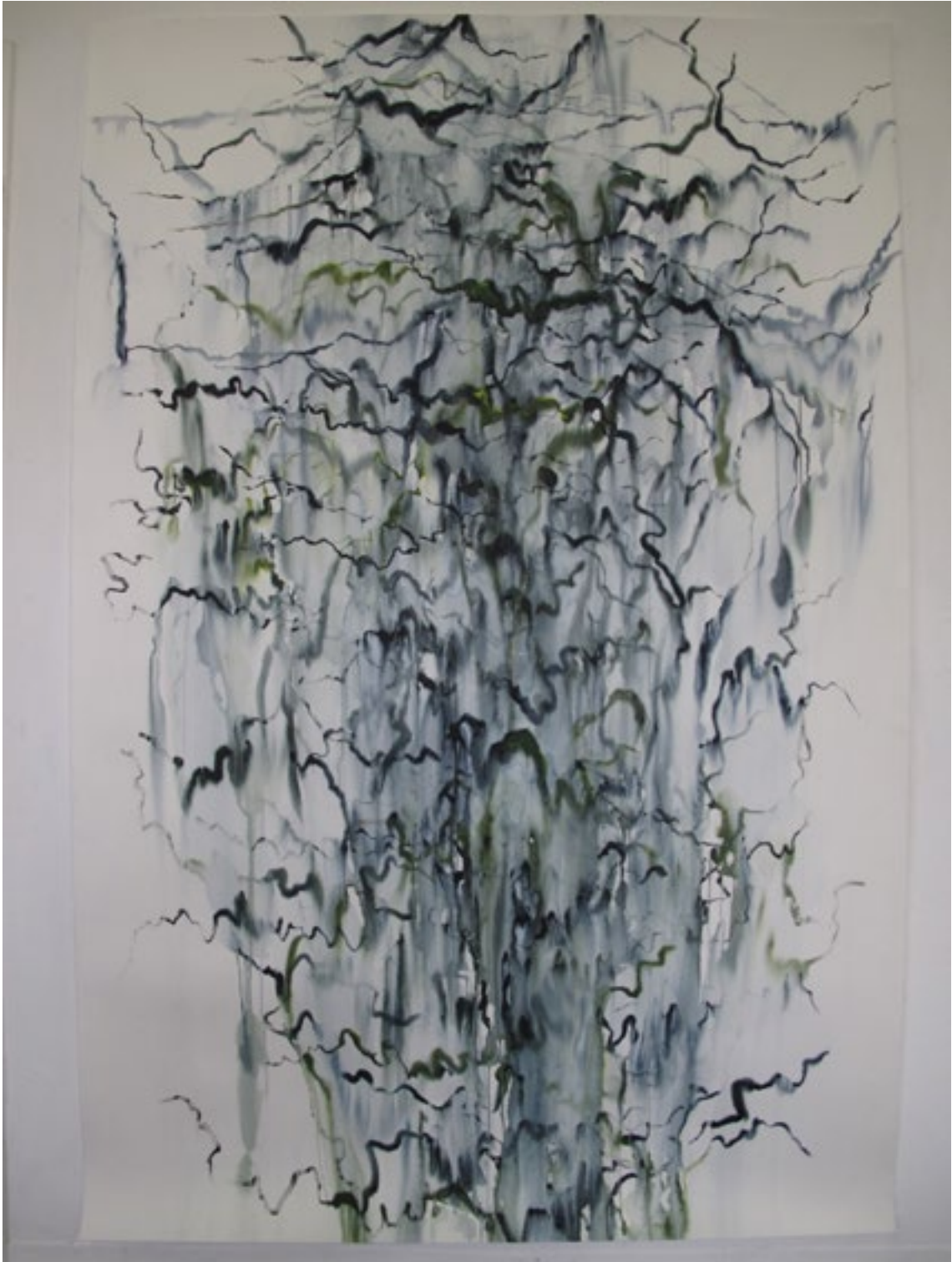
hängende gärten, aquarell, 200 × 135cm, 2011