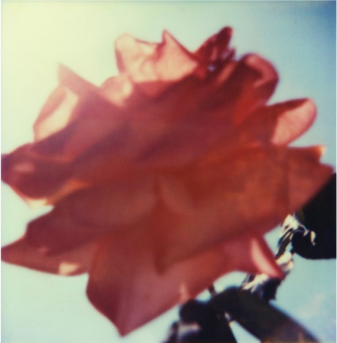
in paradiso, lambda-print, 1m × 1m, unikat, 2011