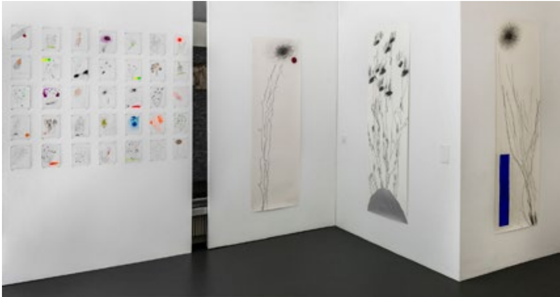
ausstellung k. sutter basel, 'la main libérée, 2014