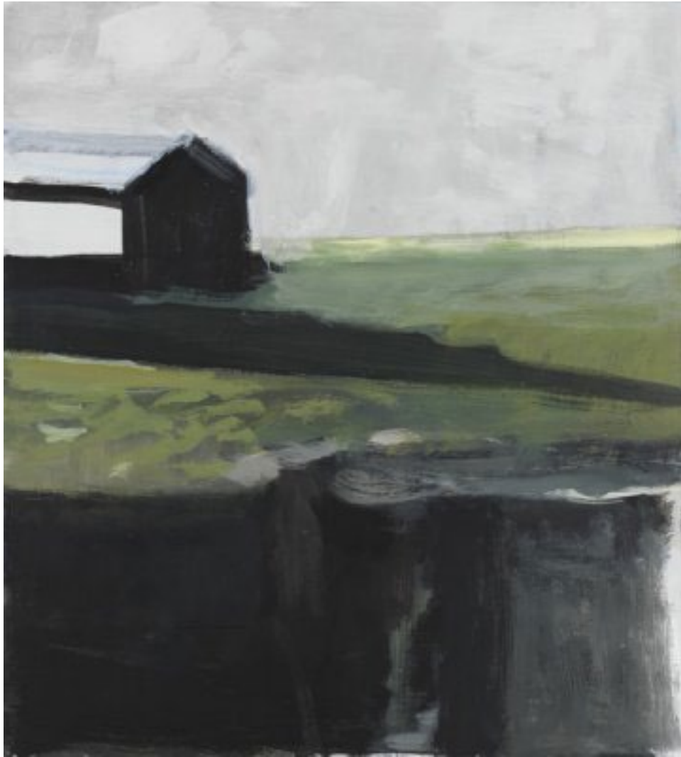
2010, Öl auf Holz (MDF), 40 × 36 cm