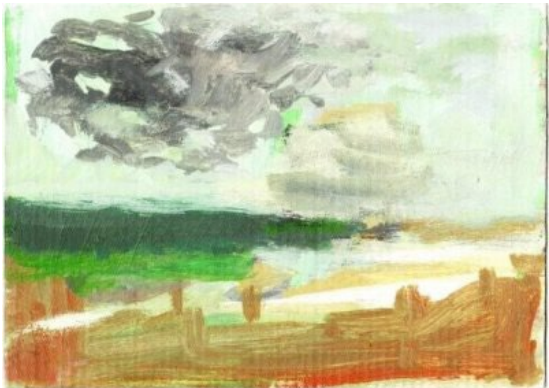
2010, Gouache/Öl auf Karton, 14.5 × 20.5 cm