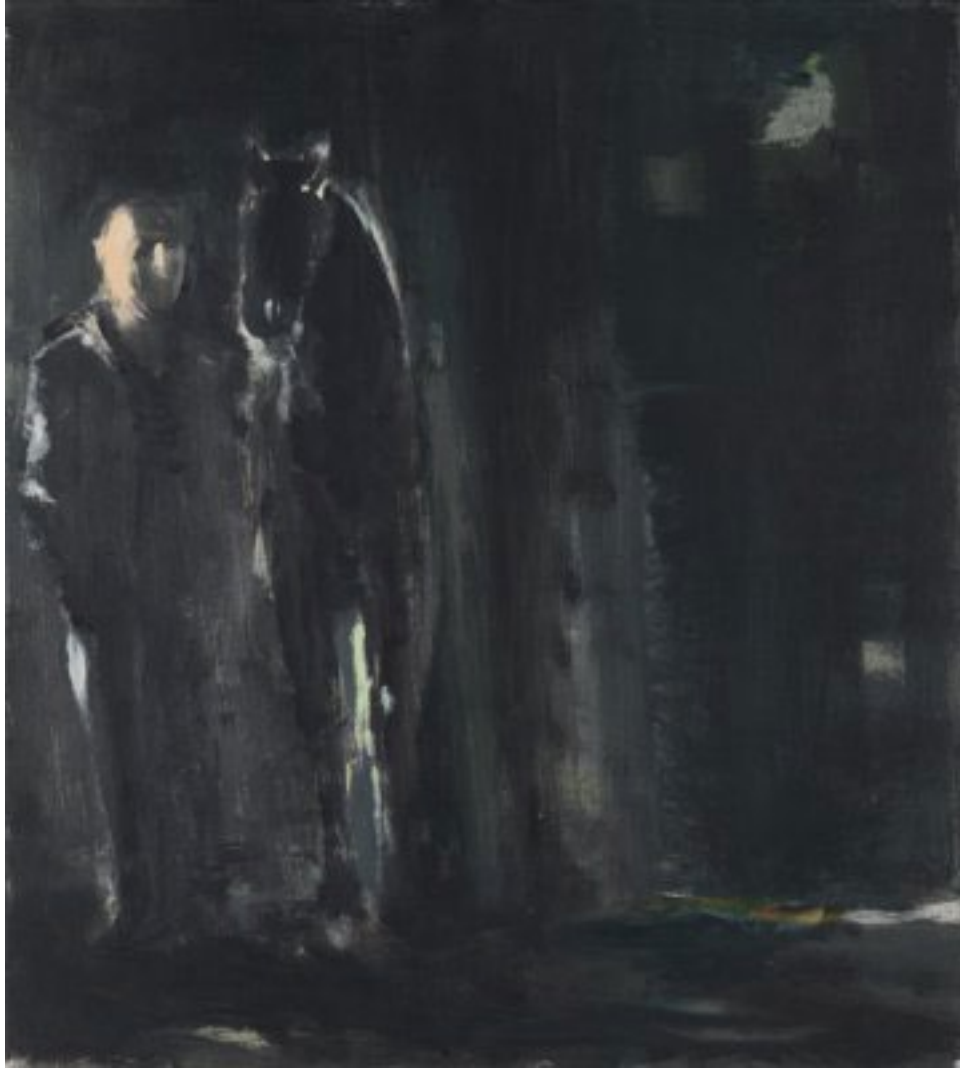
2010, Öl auf Holz (MDF), 40 × 36 cm