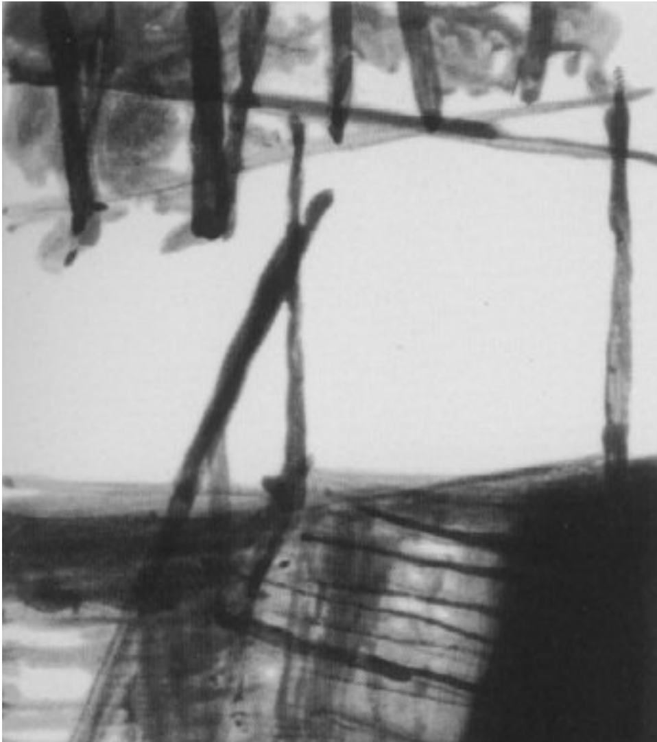
2003, Heliogravuren/Pinselätzung, Zustand 4, 40 × 36 cm