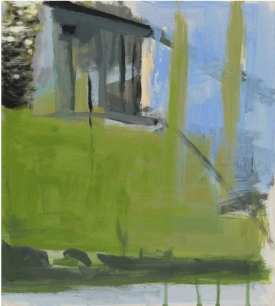
2010, Öl auf Holz (MDF), 40 × 36 cm