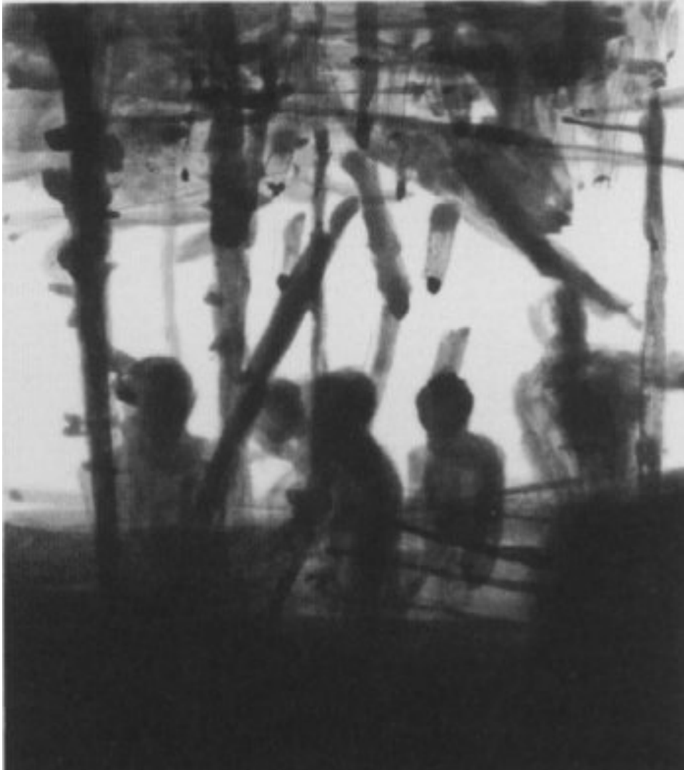
2003, Heliogravuren/Pinselätzung, Zustand 6, 40 × 36 cm