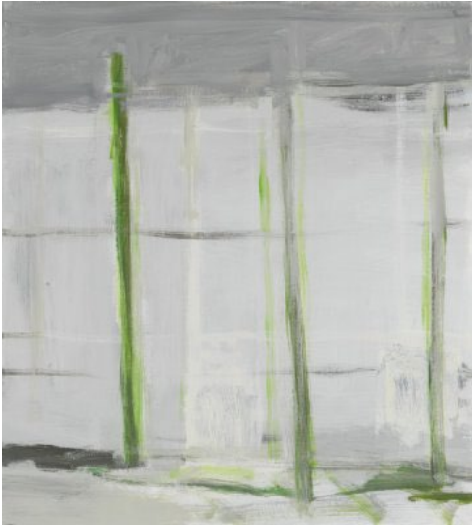
2010, Öl auf Holz (MDF), 40 × 36 cm