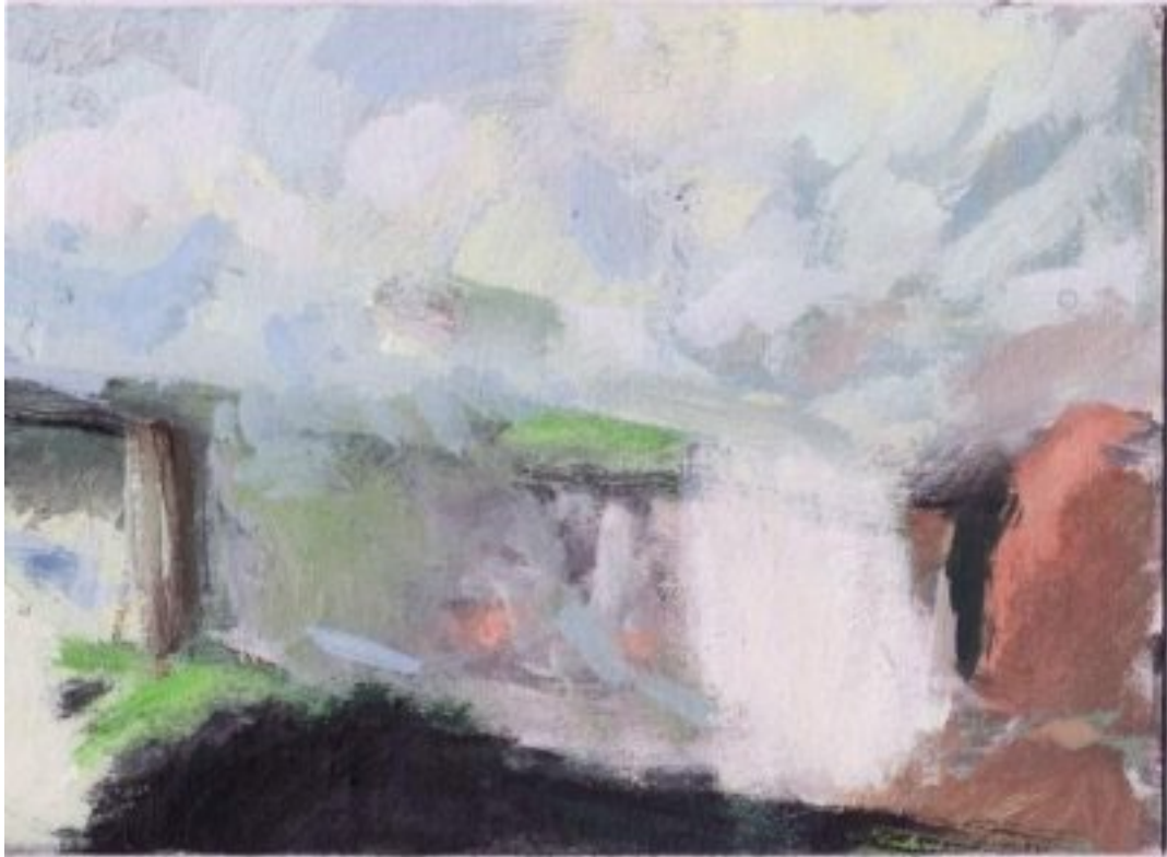
2010, Gouache/Öl auf Karton, 14.5 × 20.5 cm