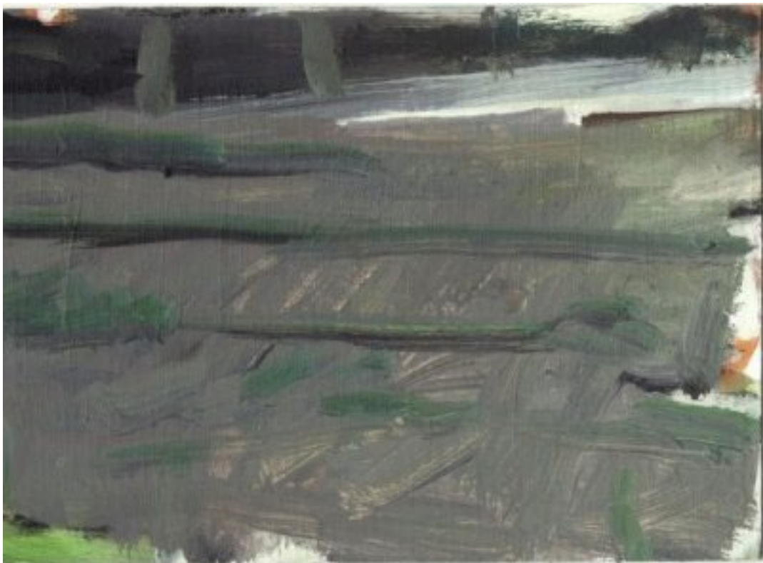
2010, Gouache/Öl auf Karton, 14.5 × 20.5 cm