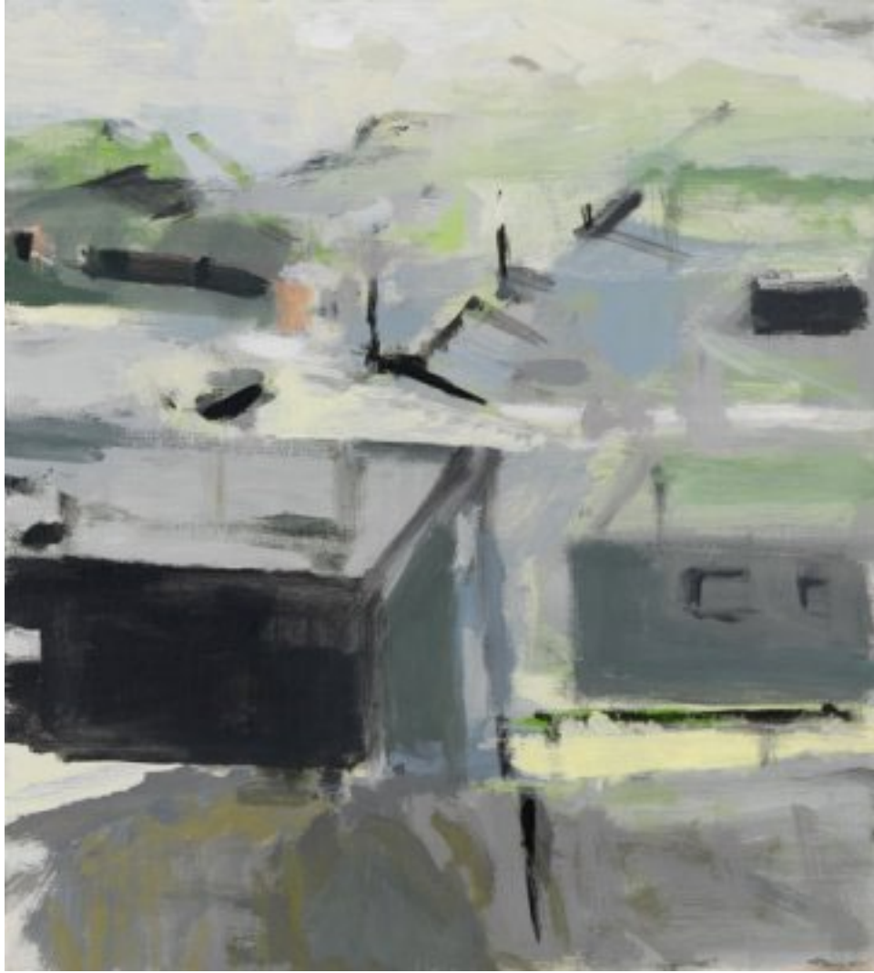
2010, Öl auf Holz (MDF), 40 × 36 cm