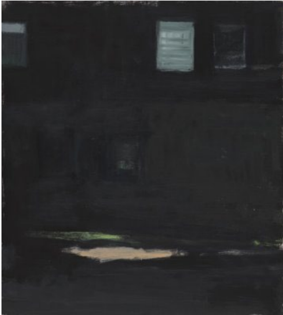
2010, Öl auf Holz (MDF), 40 × 36 cm