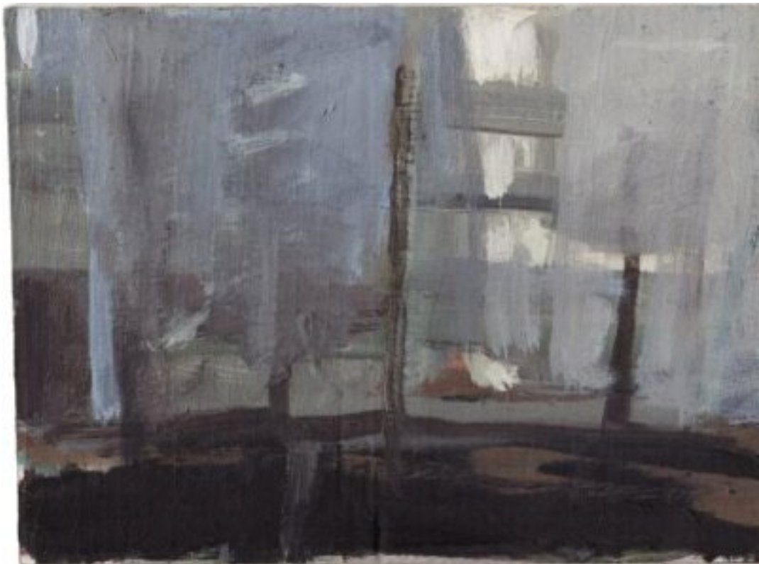
2010, Gouache/Öl auf Karton, 14.5 × 20.5 cm