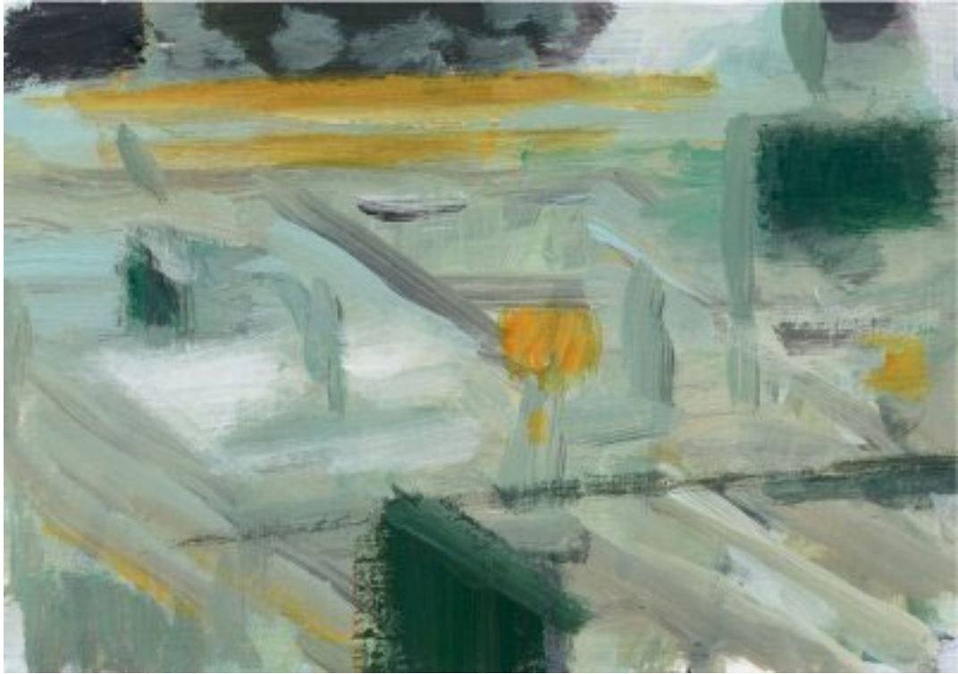
2010, Gouache/Öl auf Karton, 14.5 × 20.5 cm