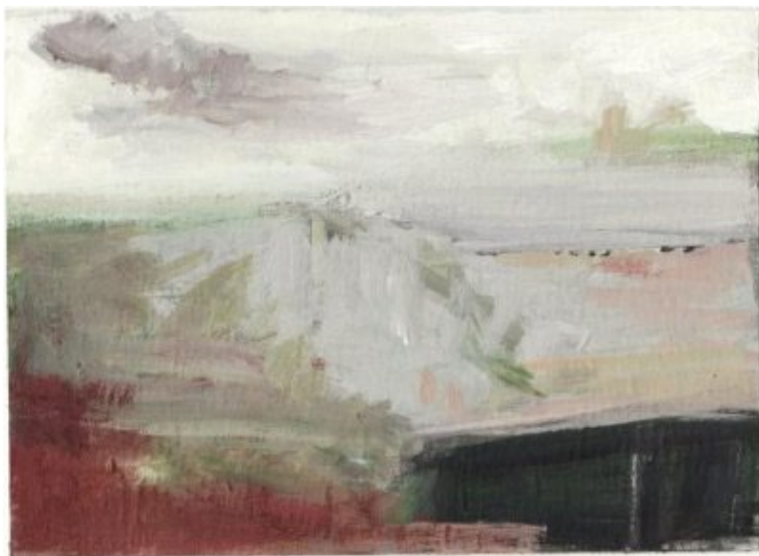
2010, Gouache/Öl auf Karton, 14.5 × 20.5 cm