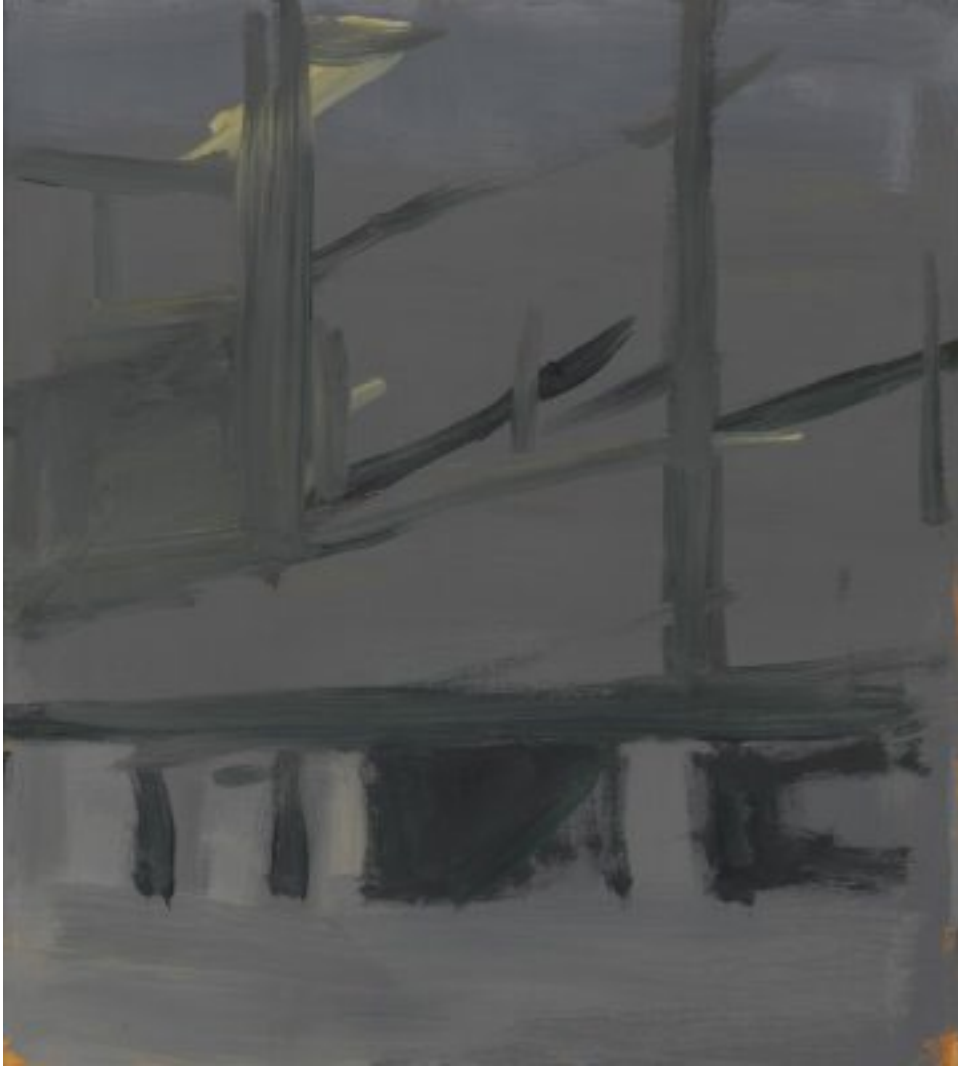
2010, Öl auf Holz (MDF), 40 × 36 cm