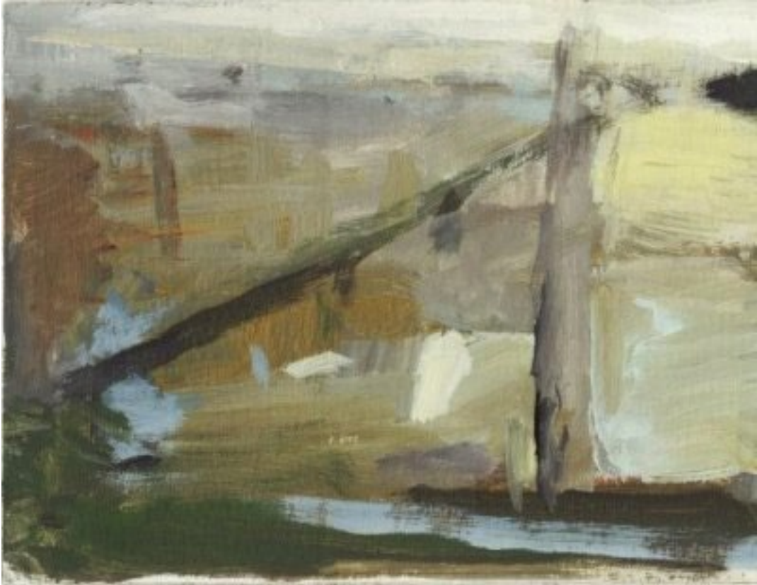
2010, Gouache/Öl auf Karton, 14.5 × 20.5 cm