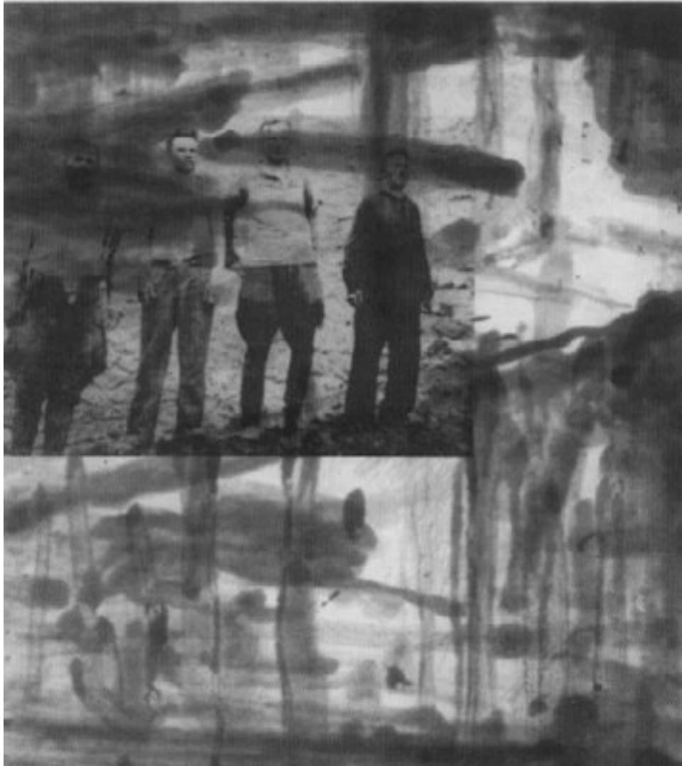
2003, Heliogravuren/Pinselätzung, Zustand 2, 40 × 36 cm