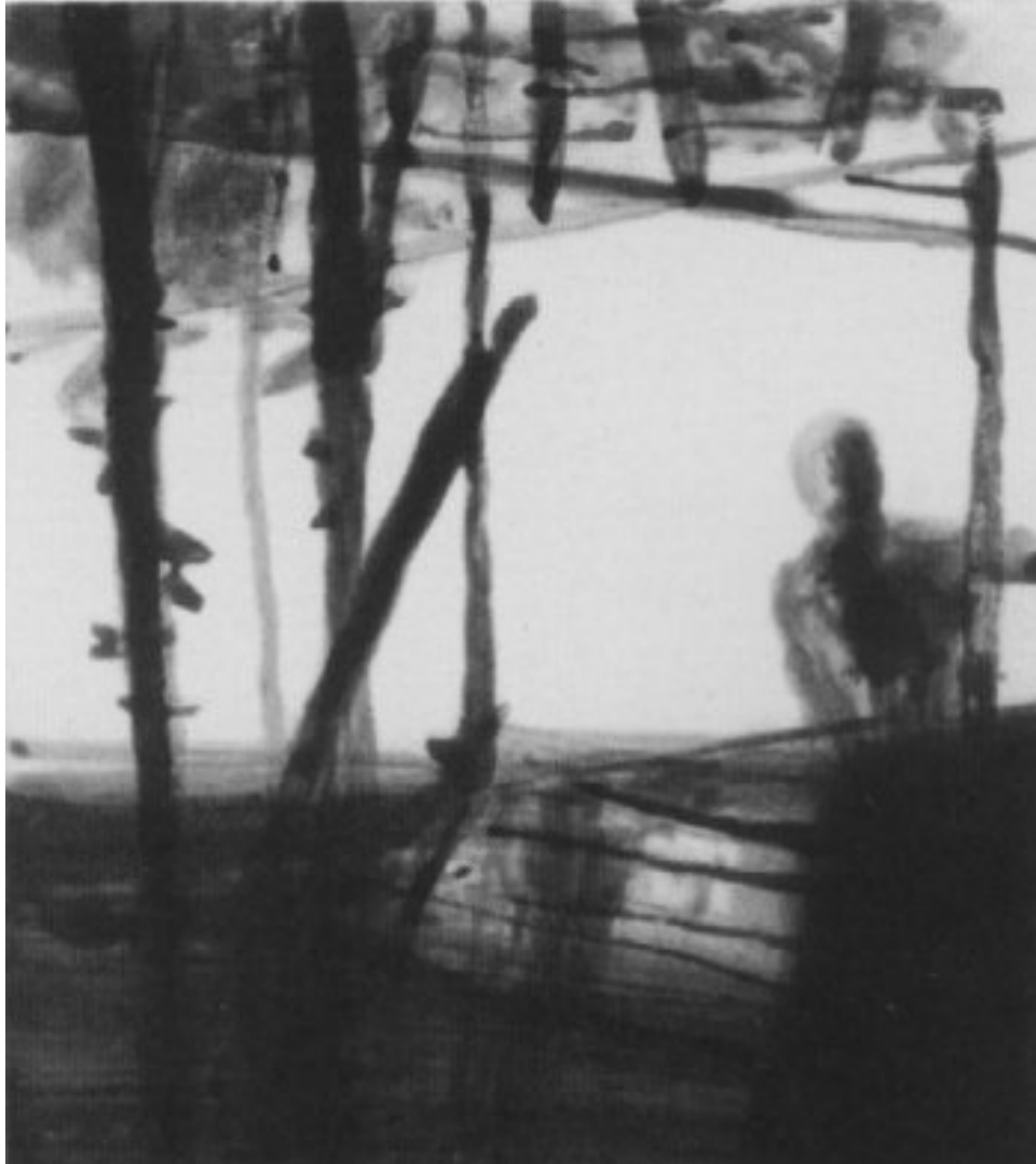
2003, Heliogravuren/Pinselätzung, Zustand 5, 40 × 36 cm