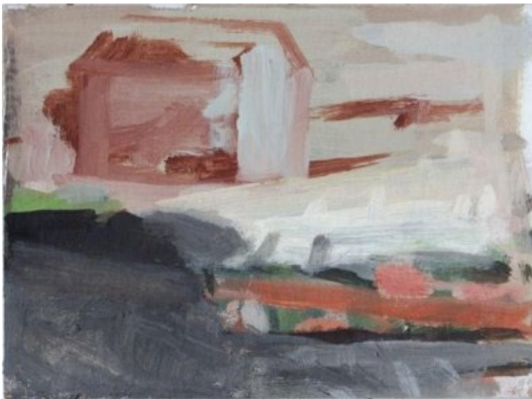
2010, Gouache/Öl auf Karton, 14.5 × 20.5 cm