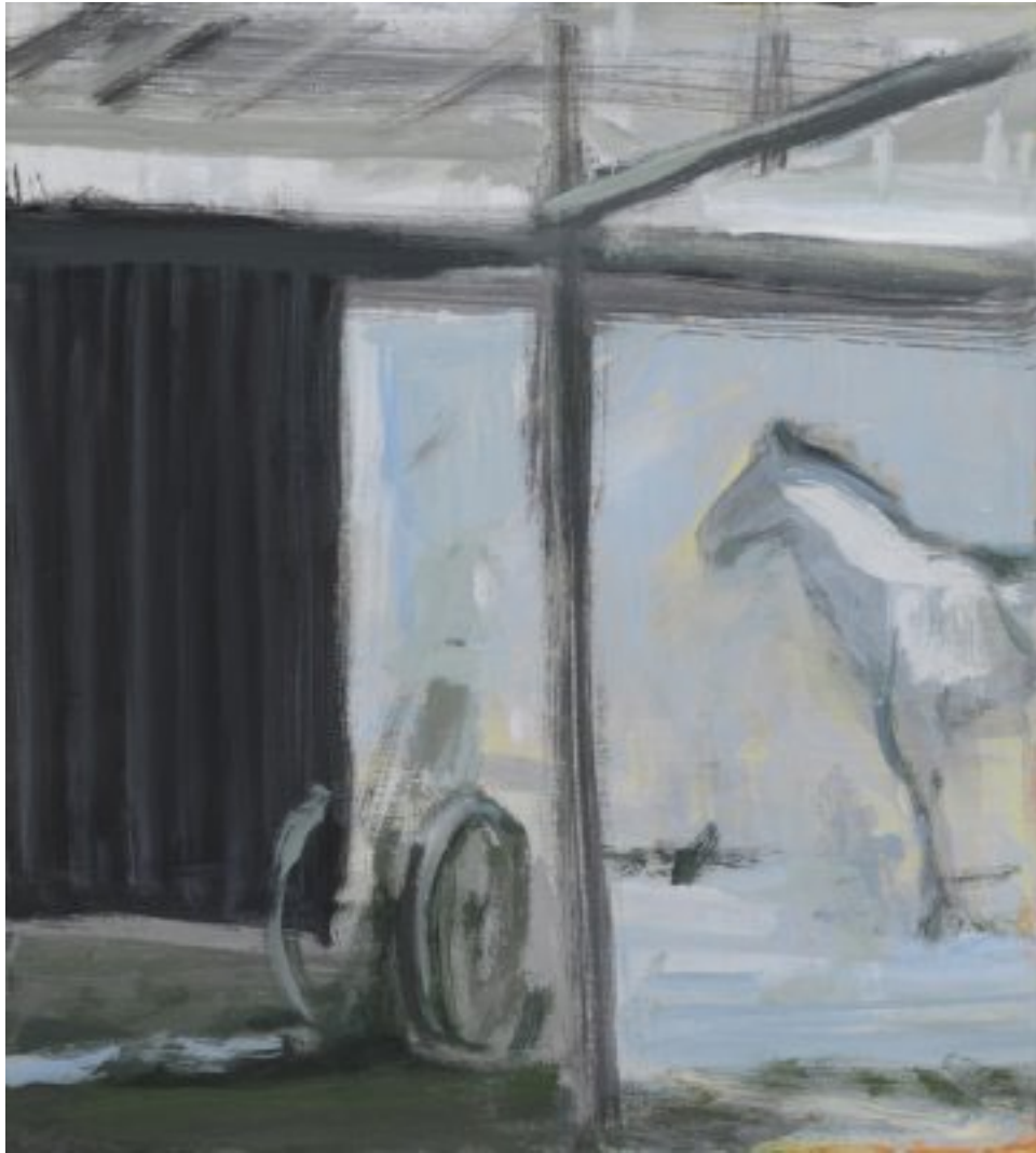
2010, Öl auf Holz (MDF), 40 × 36 cm